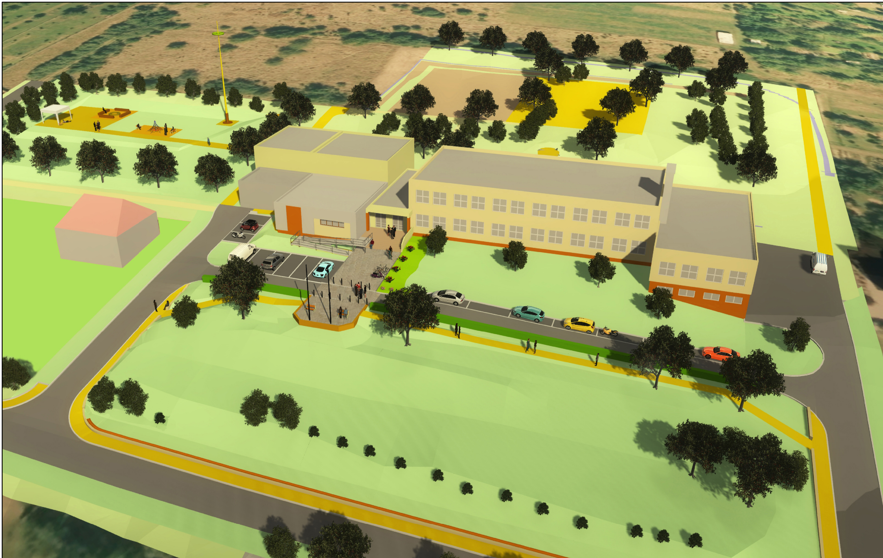
Základní a mateřská škola s návrhem řešení prostoru směrem k ul. Podhájí