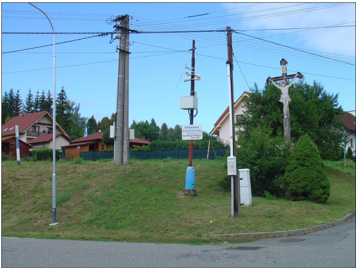
Křižovatka ulic Podhájí, Spojovací a Lúčky - stav