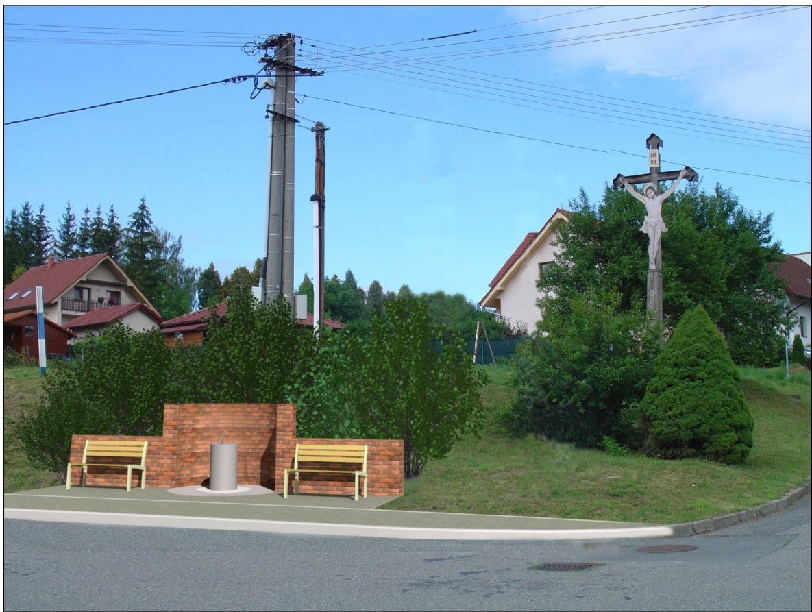
Křižovatka ulic Podhájí, Spojovací a Lúčky - návrh

PROJEKT ÚZEMNÍ STUDIE ORP UHERSKÝ BROD JE SPOLUFINANCOVÁN EVROPSKOU UNÍÍ