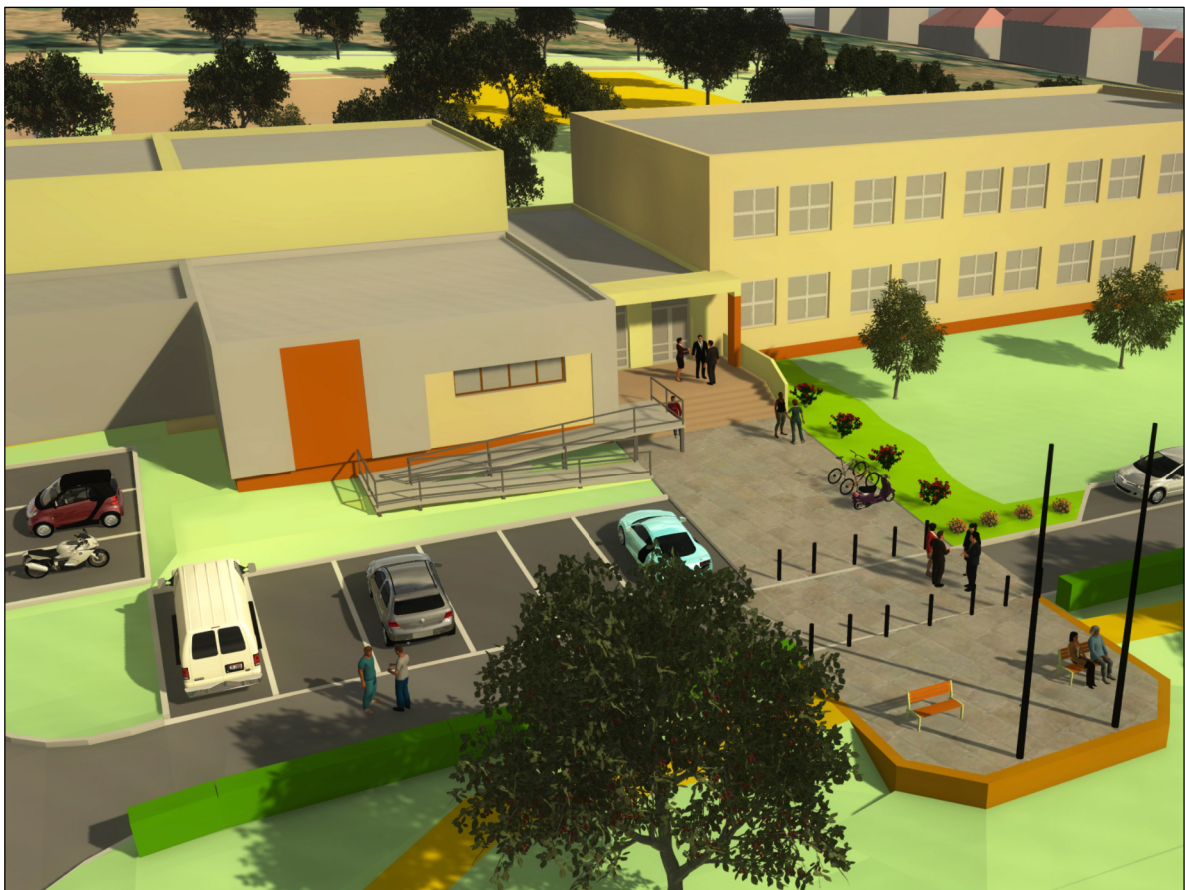
Vstup do základní školy